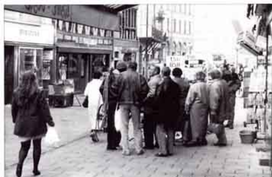
La rue d'Austerlitz, une réussite certaine.