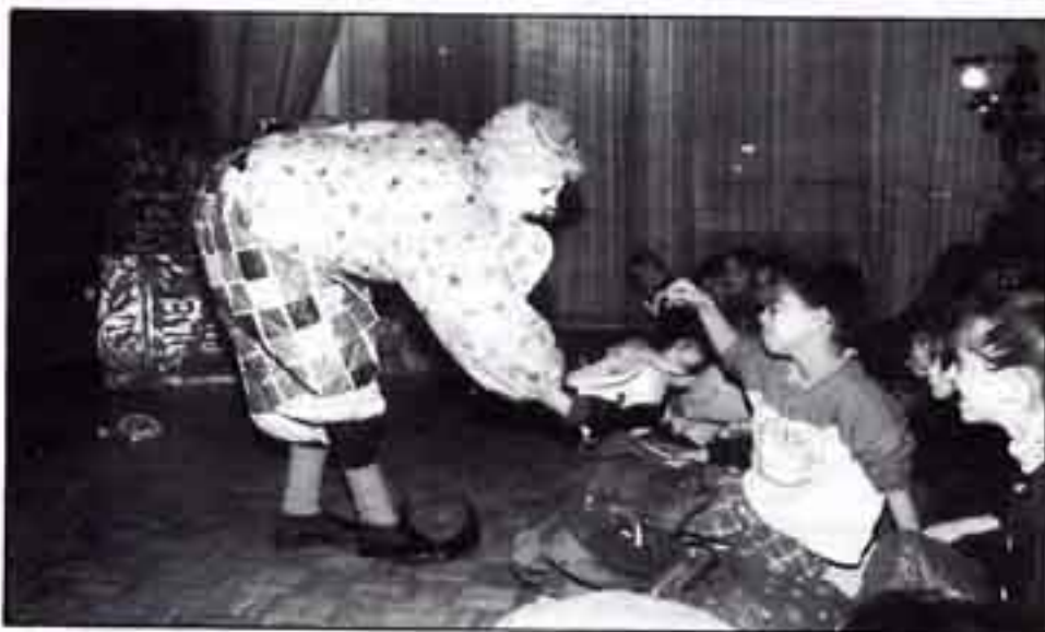
Les enfants cherchent le numéro de la page de l'histoire du clown