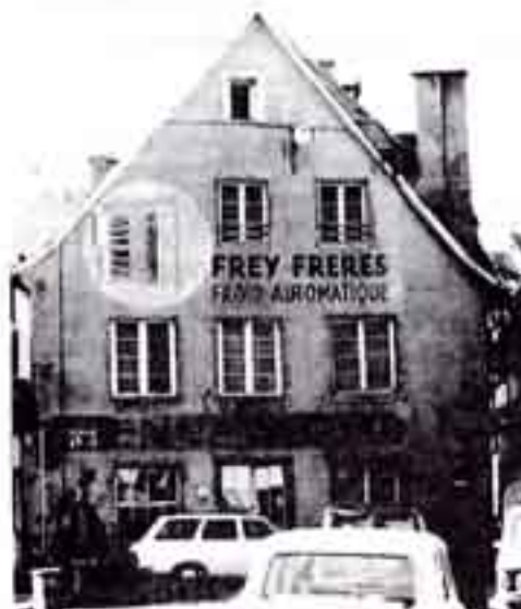
Une des plus anciennes maisons du quartier, détruite pour faire place au silo à voitures.