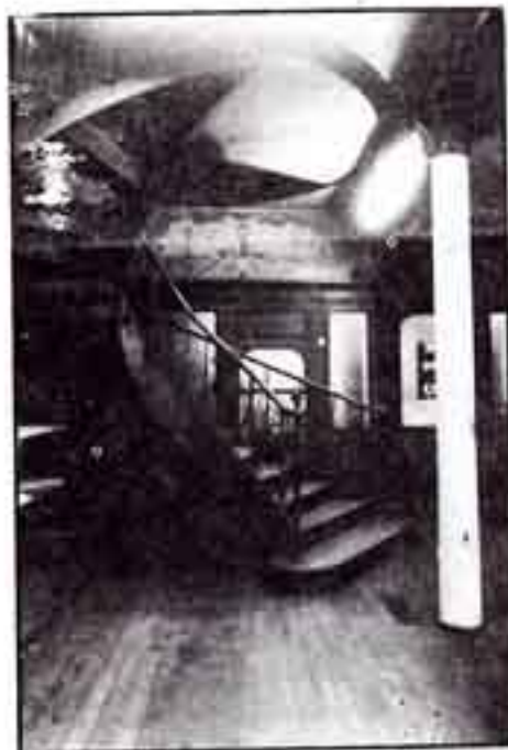
Dernière un escalier en fer forgé, le bureau, de toute beauté.