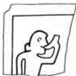
Personnage soufflant du cor. Décor d'un carreau de passage de sol d'une maison. Vers 1300.

COUR DES BOEUFS, LE SILO A VOITURES PROJETÉ PAR LA MUNICIPALITÉ EST AUJOURD'HUI EN FONCTION. POUR PERMETTRE L'IMPLANTATION DE CE BATIMENT, DES MAISONS PARMI LES PLUS ANCIENNES DE STRASBOURG ONT ÉTÉ DÉTRUITES. HEUREUSEMENT, AVANT QUE LES VESTIGES CONTENUS DANS LE SOUS-SOL NE SOIENT EUX AUSSI DÉTRUITS PAR LES MACHINES, LES ARCHEOLOGUES ONT PU FAIRE DES FOUILLES.