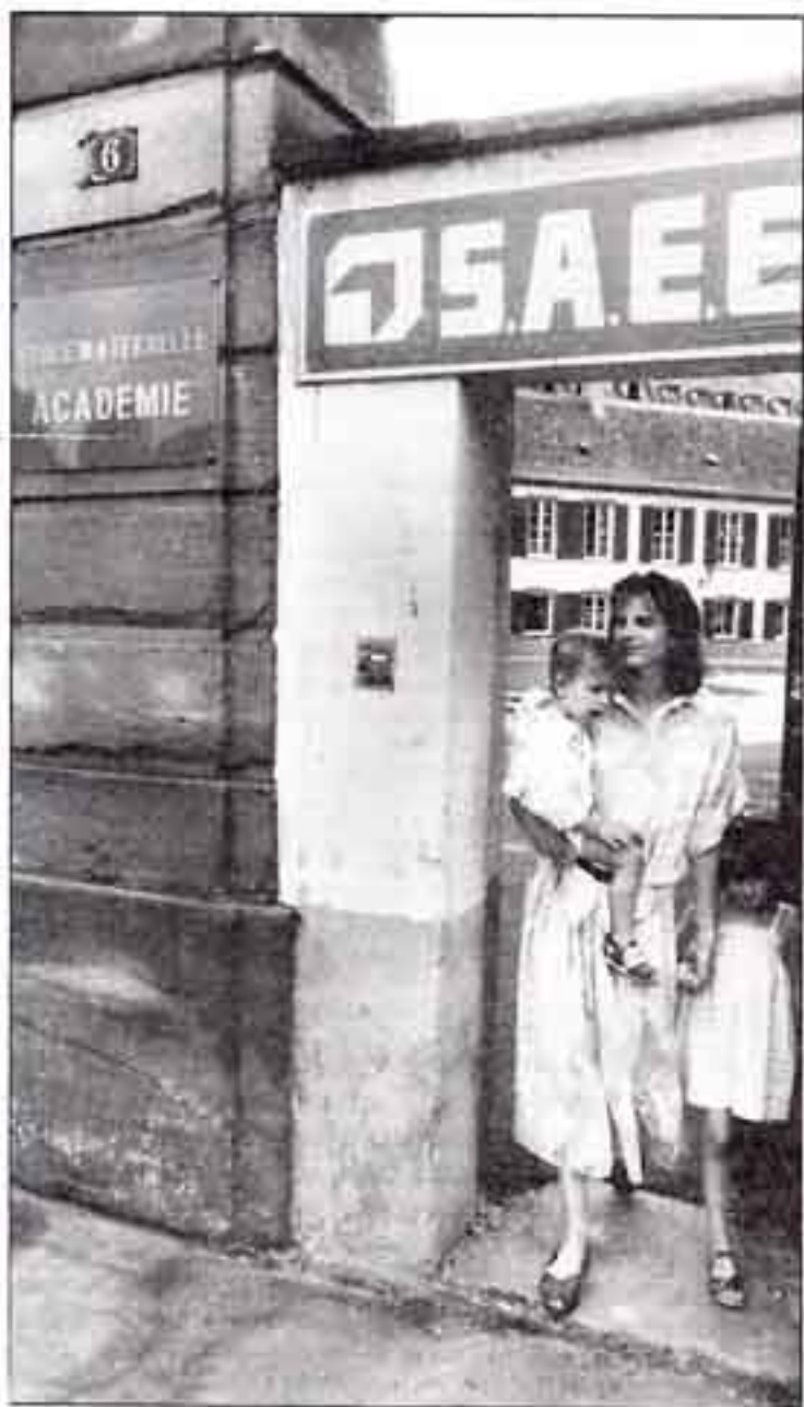
Septembre 1987, premières émotions à l'École Maternelle