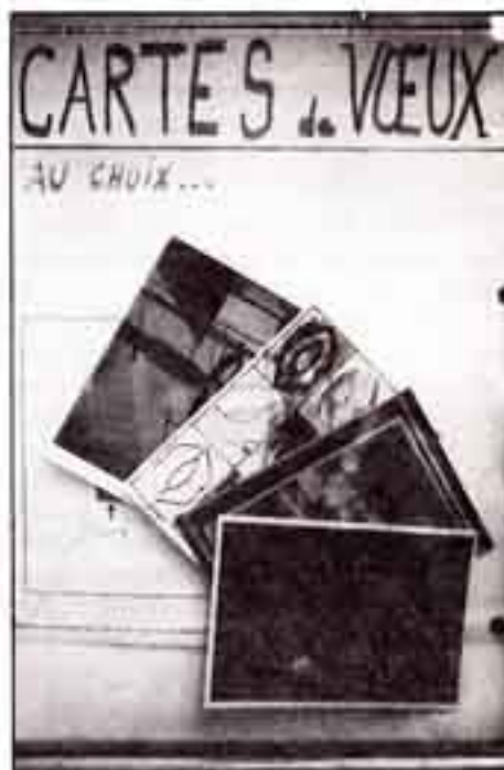
Chaque carte est tirée à une centaine d'exemplaires.

Le choix du support fait de l'initiative du "Coeur m'en dit" la première expérience artistique de ce genre en France. Même en étant allergique à toutes formes d'art, on peut très bien envoyer une de ces cartes à quelqu'un de cher pour lui communiquer un peu de chaleur, de joie ou de bonheur. Car le graphisme offrant un contenu est porteur de message, si bien que tout texte au verso est quelquefois superflu. Ce qui nous change bien des habituelles cartes qui hantent les tourniquets des lieux les plus touristiques de Strasbourg.