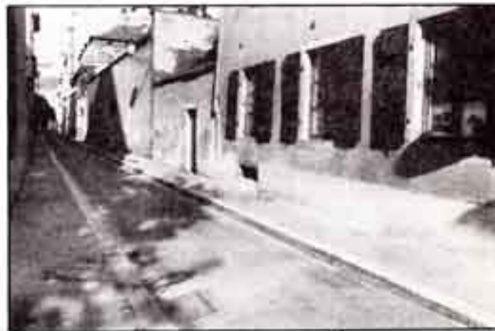
Au 27, rue Ste Madeleine, le Coeur m'en dit.

En cette période de rentrée, les cartes postales évoquent pour un grand nombre d'entre nous, des souvenirs de vacances ou de voyages.